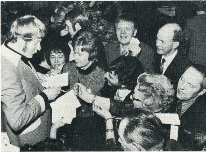
Tore Skogman möter autografjägarna med upphöjt lugn.