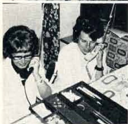
växeln har fått blommiga tapeter.