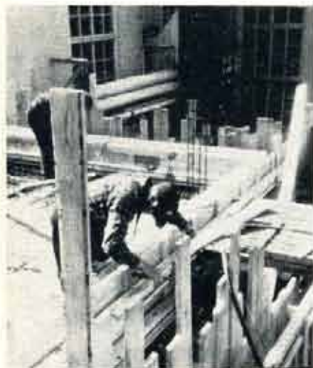
Nu är det nya kylvattentornet i bruk