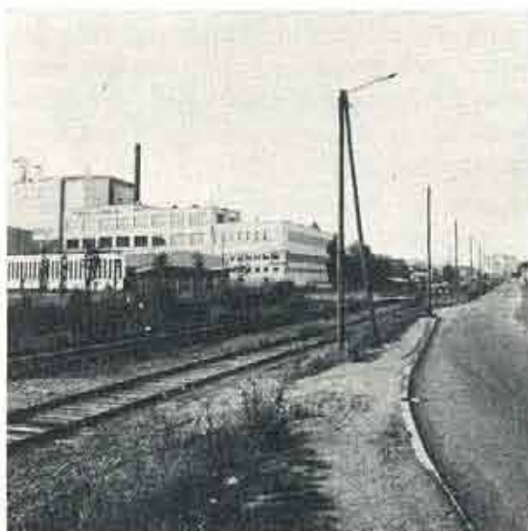
ÅBOTVÅL ligger på Järnvägsgatan i ett industriområde i Åbo. Sunlight i Nyköping har daglig kontakt med denna industribyggnad.

Svenska Unilever har cirka 300 anställda i Åbo samt 100 vid huvudkontoret i Helsingfors.