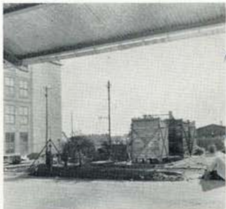
En bild från kylskeppet för glycerinverket. Här borrade man också efter vatten, cirka 100 meter ner, men det gav inte så mycket. Kortet är taget under femtio-talet. Märk att labb och tryckeri ännu inte är tillbyggt.

— Det är oerhört fin sammanhållning på verkstaden, berättar Gösta.