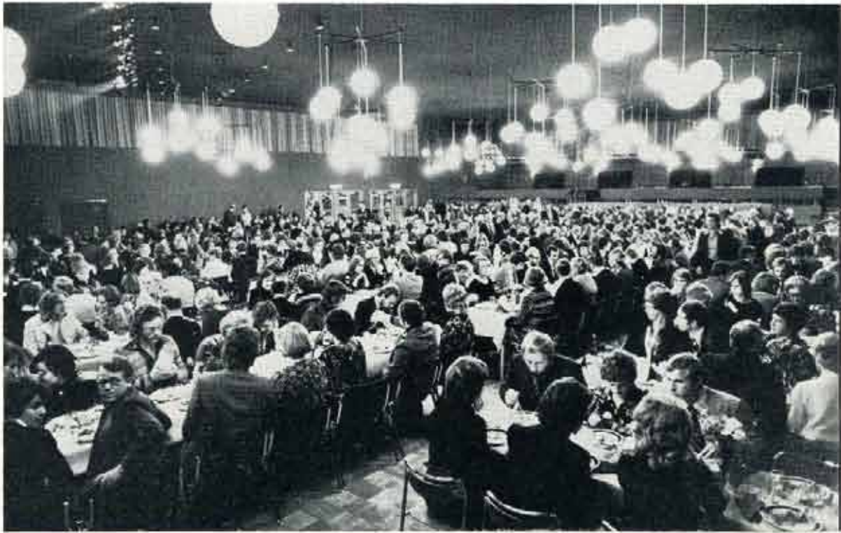
Folkborgen i Norrköping blev full av "Sunlightare". 650 personer infann sig. På bilden har man just börjat med landgången.

ders rykande soppa. Däremot gillade många hans köksredskap som lottades ut på placeringskortet. Elektrisk kaffebryggare, en eldriven visp och köttblandare, tryckkokare och en minigrill hörde till de uppskattade vinsterna.