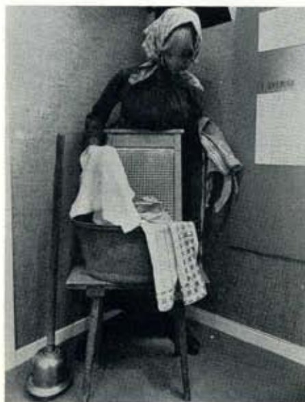
"Tvättgumman" hade 1920 en dagslön på två kronor.

Visste du att Sunlight tillverkade Vim, Lux tvålflingor, Rinso, Sunlight tvål och Lobol år 1925? Att företaget lanserade Lux toalettvål 1929, Radion 1936, Surf 1953, Via 1957 och Shield 1973? Det och mycket mer kan du läsa om på museet.