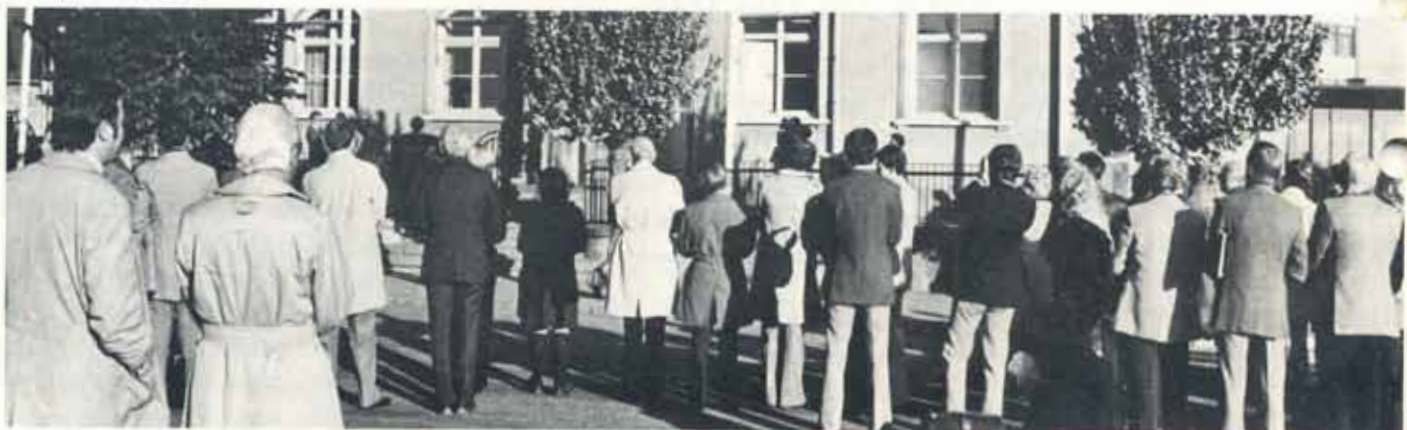
...och på Nytorget hade fält- och stabspersonal samlats för att lyssna och övervara flagghissningen.