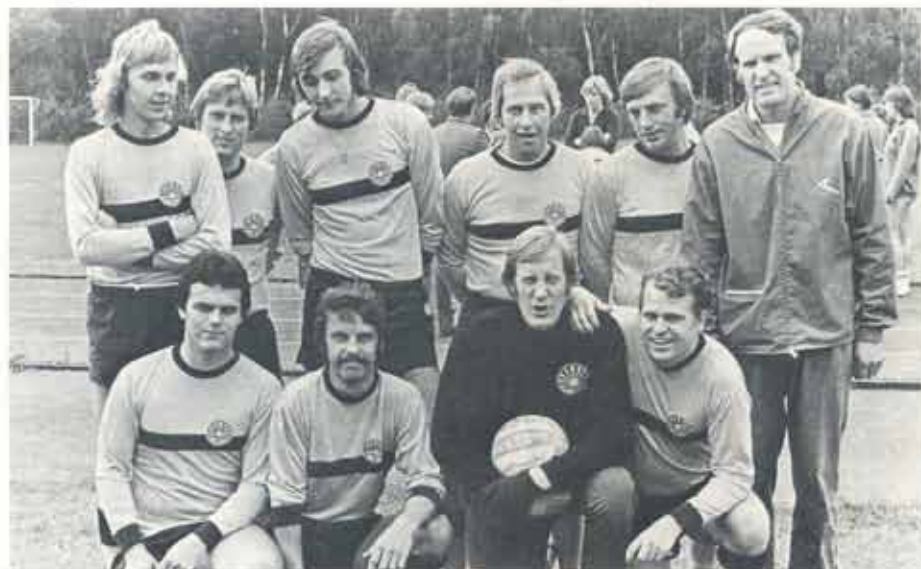
3:a i herrarnas fotboll kom Sunlights Nyköpingslag. Inget att vara ledsen för.