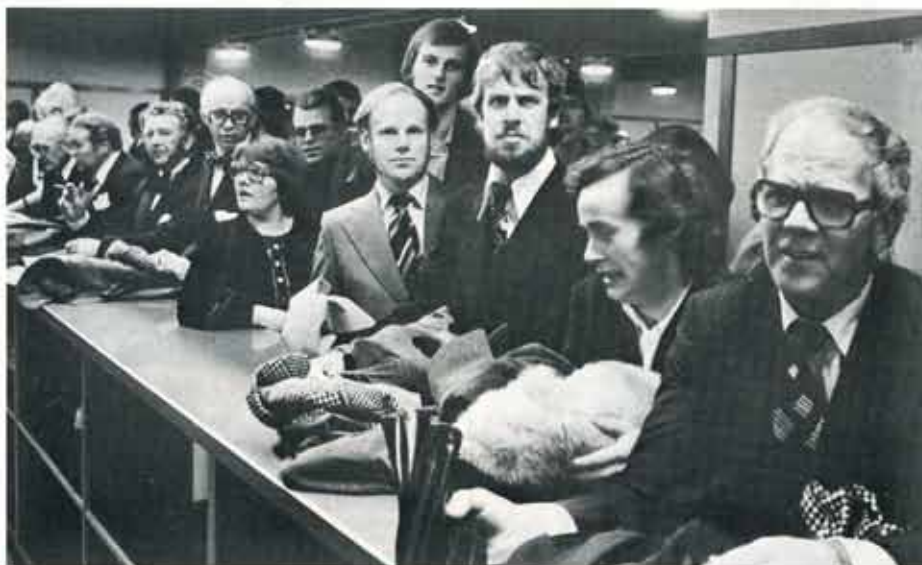
"Hallå där!" — Säj, vaktmästarn". Folket trycker på, första bussen har anlänt till Borgen och alla är angelägna att skaffa sig en bra plats.