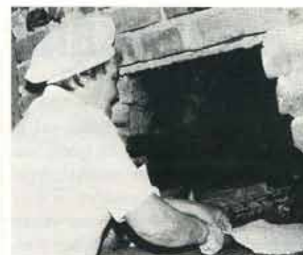
...där tunnbrödsbakarna hanterades med enorm skicklighet på den öppna spishällen.

Detergenten vill förmedla ett hjärtligt tack från deltagarna till företagsledning för initiativet till och subventionen av vistelsen. Inom studierådets ram kommer vi under hösten att i någon form informera mera om begreppet "friskvård", eftersom alla ansåg det vara en viktig angelägenhet värd att sprida kännedom om.