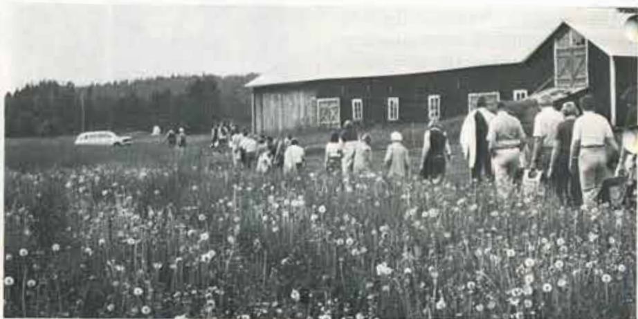
Gulsele getfarm. Över doftande blomsteräng på väg till tunnbrödsbageriet...