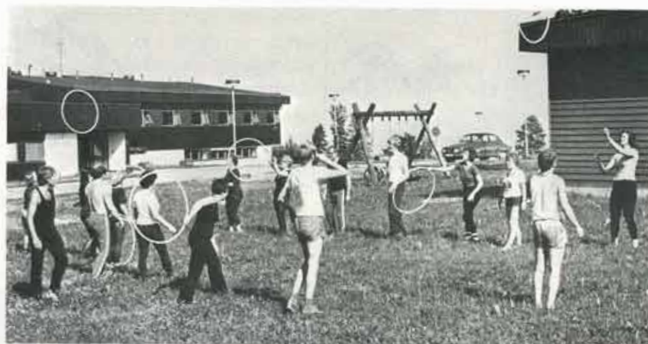
När vädret så tillät hölls gymnastiken utomhus. Och i vilken luft sen!