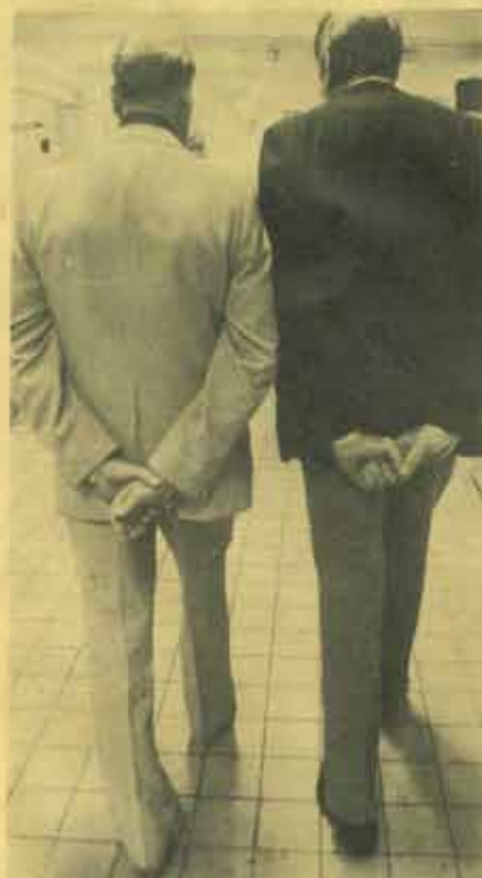
Medlemmar i "De bakbundnas klubb"? Involverade i politiska diskussioner? Inte heller det, just nu i alla fall, för det var nämligen