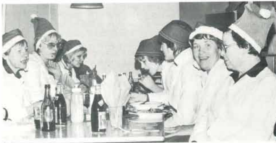
..... och när den långa matkön dan före julafton var avklarad så var det dags för serveringstomtarna att hänka sig och få sitt.