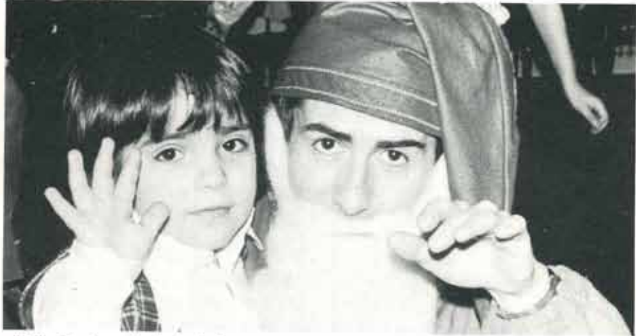
Hej då, vi ses i nästa år igen.....