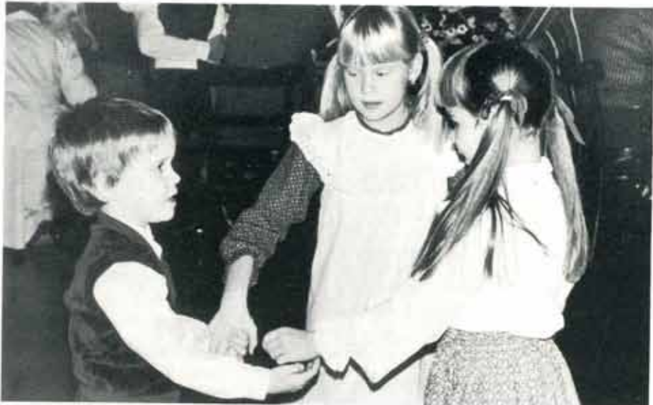
Va inte blyg nu killen utan kom med oss och dansa.....

...kningar, omorganisationer, m.m., det för- n alltid infinner sig dan före dan på jobbet. ...där ändå. Tomteluvor vippade lite varstans ...r vid den uppskattade gratislunchen, som ...en gärna åtar sig att förmedla ett hjärtans ...äl tradition? Eller hur? Inte minde än 240 ...eftermiddagen doftade det av kaffe i varje ...g omkring med tårkartonger. Men många ...var väl ingen protest? Kom igen nästa år!!! ...et kom 70-talet barn för att dansa ut julen ...mans med lika säkra och spelglada musi- ...Och tillsammans med gotte-påsen och bar-