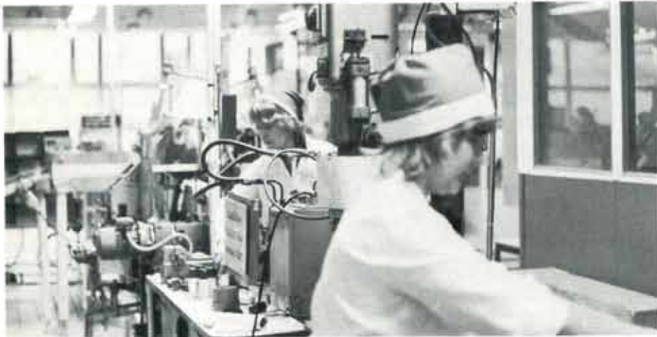
På flytande produkter satt tomtar och fyllde timotei.....