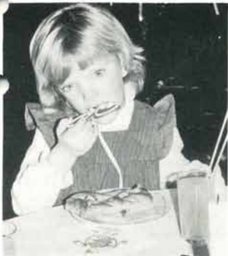
Det är bra roligt med julen, men nu får man vänta ett helt år.