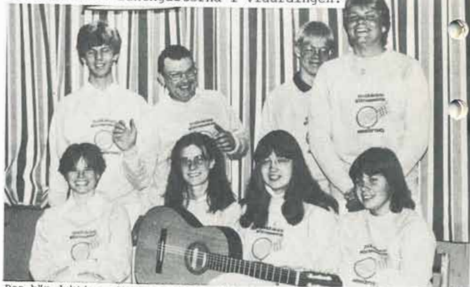
De underhöll lunchgästerna i Vlaardingen!