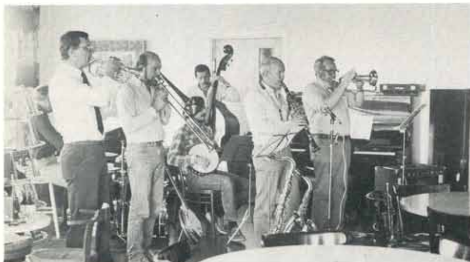
Ett härligt sug drog Dixie-gruppen upp i gamla sköna evergreenare som Take the A-train , Tuxedo Junction , ..... m.fl.