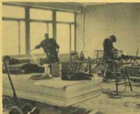
Före jul ska Leverindus ta emot kunder här för att visa produkter och system i den ca 100 kvm stora demonstrationslokalen.