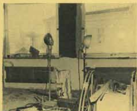
Här står två lampor och ser skamsna ut i allt bråtet. Men om ett par veckor sammanträds här i "Rosa rummet".