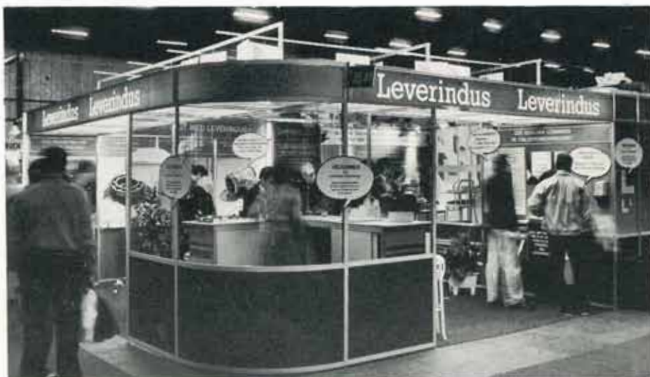
På TEKNISKA MÄSSAN i Stockholm deltog Leverindus för första gången. Temat var "Rent och Tryggt med Leverindus".

Nästa mässa av den här typen kommer att hållas i Stockholm och det blir GASTRONORD 1985.