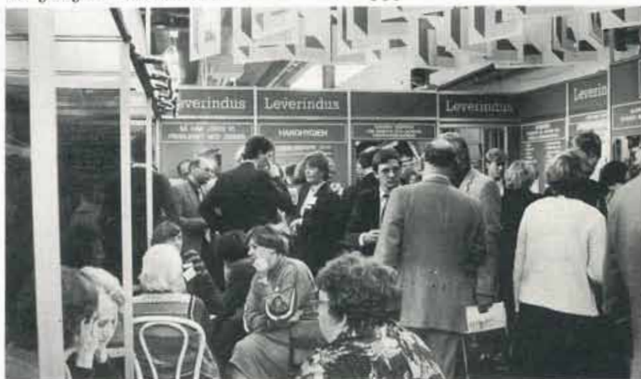
Leverindus monter var så gott som alltid fylld med människor, som här på RESTA-mässan i Malmö.