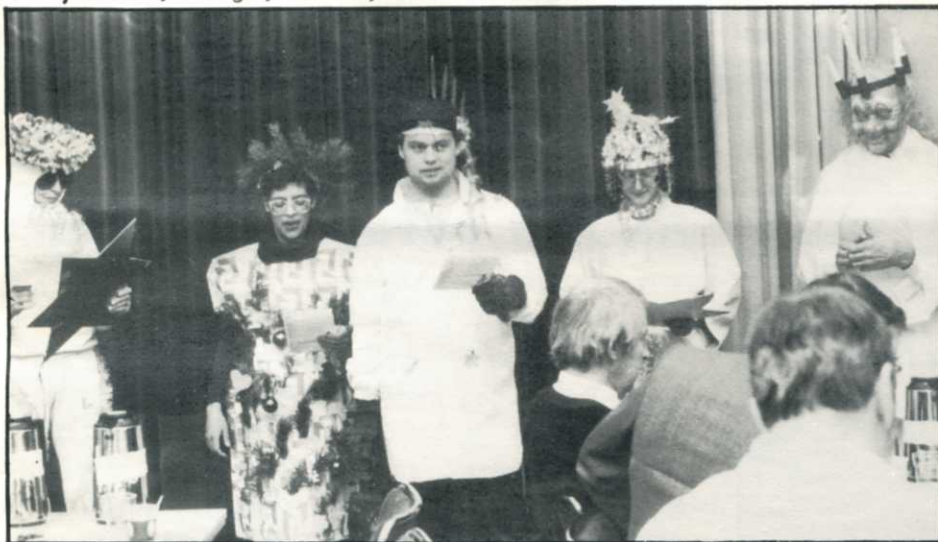
Otto var en stalleddräng, vi tackom nu så gärna....