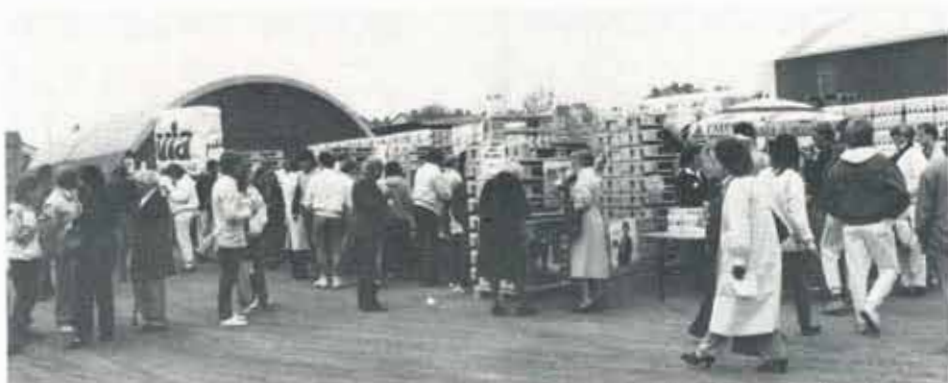
Resultatet av insamlingen för Neurologiskt Handikappade blev 5 097 kr, som betalades in till Radiohjälpen. Ett jättefint resultat!