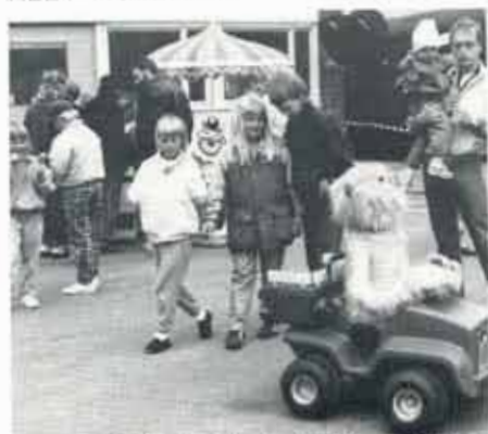
ROBOTEN RULLE i full rulle.

TACK ALLA NI SOM JOBBADE, ORDNADE OCH FIXADE SÅ ATT ALLT KUNDE KLAFFA SÅ BRA!