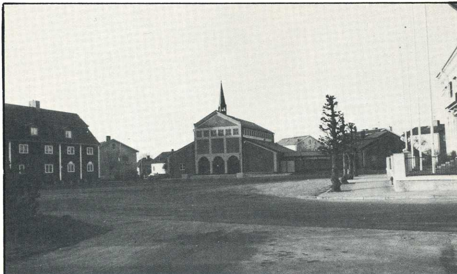
S:ta Anna katolska kyrka stod färdig i december efter sju intensiva månaders projektering och byggnation.