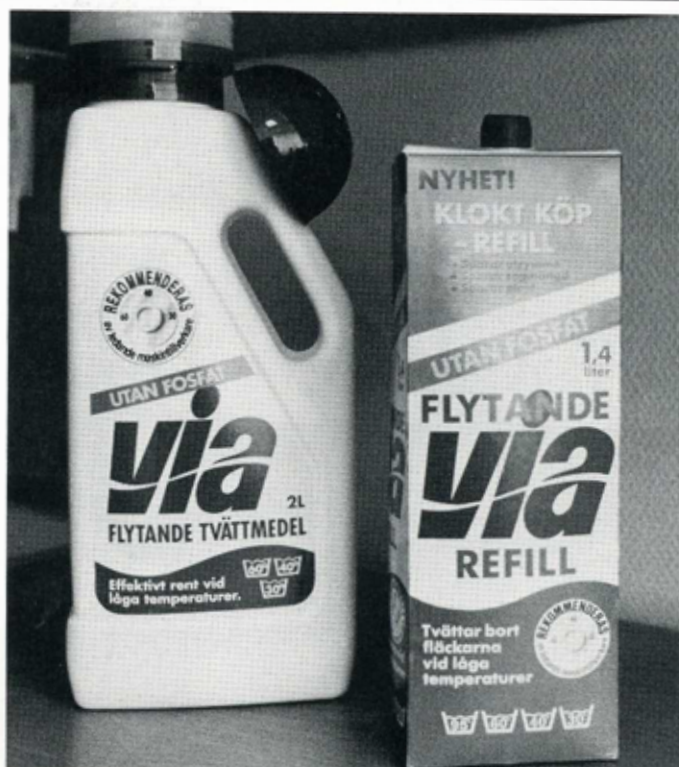
Så här ser den nya refill-förpackningen ut till flytande Via, säger Torbjörn Ohlsson. Den innehåller 1.4 liter.

Lever blir först i Sverige med den här typen av refill-förpackningar. Framtagande och lansering har bara tagit knappa två månader.