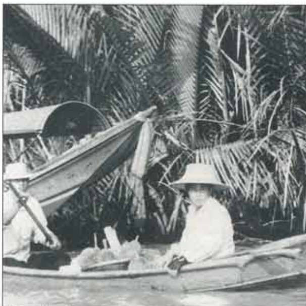
På kanalerna i Bangkok såg vi ofta sk flytande marknader. Det var en eller flera båtar, från vilka de sålde mat, frukt och grönsaker

I Bangkok finns världens största restaurang. Den är utomhus och den är så stor så att serveringspersonalen måste åka rullskridskor.