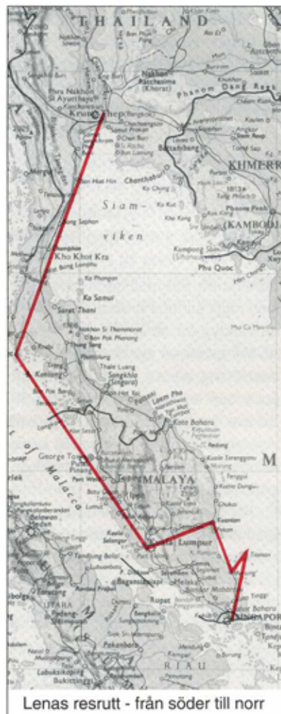
Lenas resrut - från söder till norr

Malaysiska Turistbyrå skickade oss mycket bra material - både kartor och