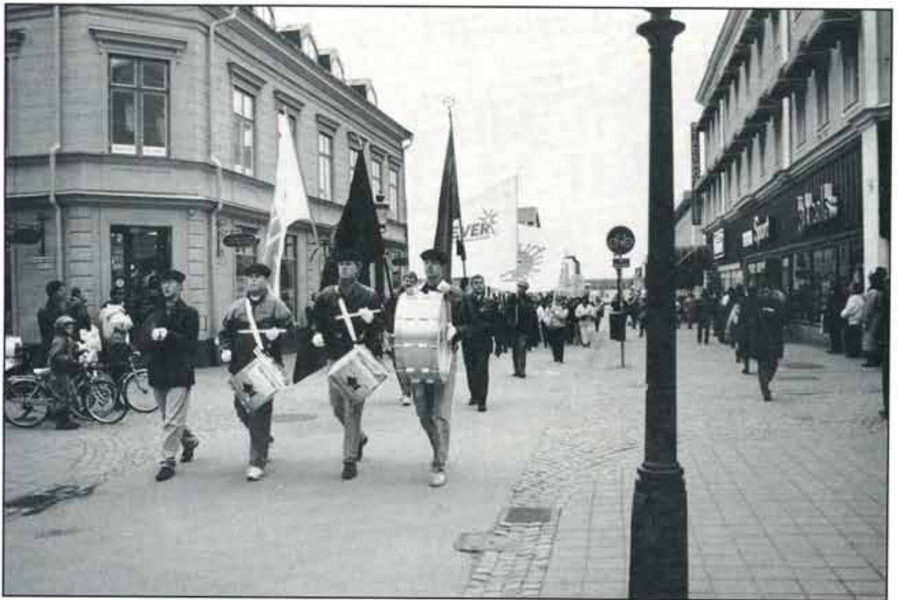
Hela Västra Storgatan från Teaterparken till Stora Torget var fylld av det manifesterande Lever-tåget. "Lever är vårt levebröd" skallade det mellan väggarna. De pensionärer som inte gick med i tåget kantade tillsammans med andra nyköpingsbor Storgatan. Musikskolans trumslagare gick i främsta ledet.