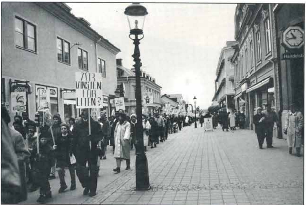
"Är vinsten för liten", "Vi vill inte bli arbetslösa", "Vi på Lever vill leva vidare", "Ska Polen göra vårt VIA?", "Investera mera - kunskapen finns!", "SAAB, Semper, C-rör, Lever - och sen?", "Nyköping behöver Lever!", "Lindman, vi saknar dig?", "Unilever - ta ert ansvar!"