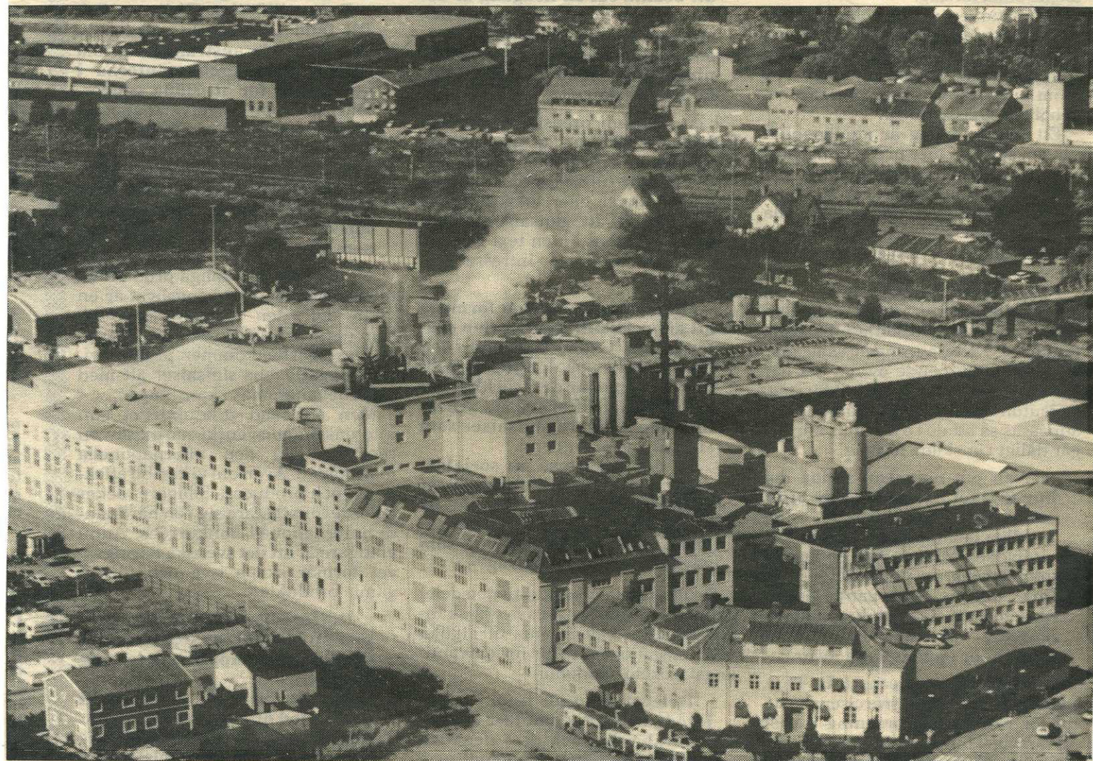
Lever stänger fabriken i Nyköping nästa sommar. Alla 265 anställda mister då sina arbeten.