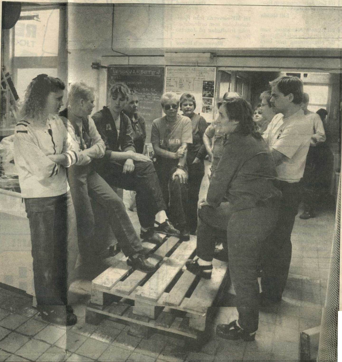
Arbetslusten var borta på tisdagen, istället ventilerades oro och vrede i grupper på fabriksgolvet på Lever.